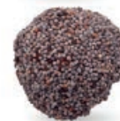
FIGA Z MAKIEM FIGS WITH POPPY SEEDS