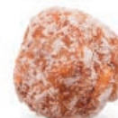
MIGDAŁY POD PALMĄ ALMOND WITH COCONUT